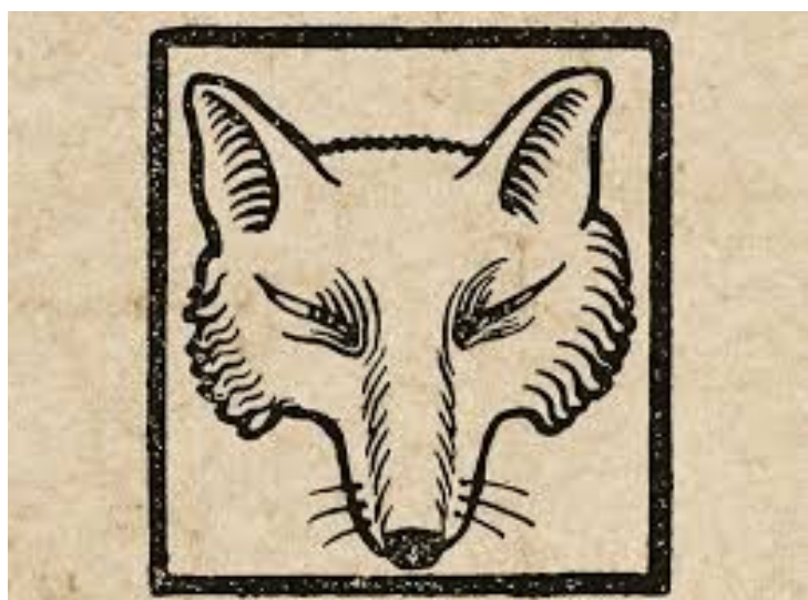
gustaaf van de woestijne. 1921

nobel stuurt bruin de beer om reinaart te gaan halen. aangekomen bij diens hol maupertuis sommeert hij de vos om mee te komen naar de koning. reinaart antwoordt dat hij al van plan was om te gaan, maar dat hevige maagkrampen hem aan huis gekluisterd hielden. bij gebrek aan beter heeft hij namelijk een vreemde spijs gegeten, honing... de beer begint te watertanden en smeekt reinaart hem te brengen naar de holle eik waarin deze honing schijnt te zitten. de boom ligt bij een timmerman voor houtbewerking; als bruin er dieper in kruipt met zijn snuit komt de beer klemvast te zitten. zijn gebrul alarmeert de omwonende dorpelingen, die te hoop lopen voor berenvlees; zelfs pastoor en koster laten zich niet onbetuigd als slager. met uiterste krachtsinspanning weet bruin zich los te scheuren. bloedend en mishandeld kruipt de beer op zijn achterste terug naar het hof. het vel van zijn oren en wangen is achtergebleven in de boom.