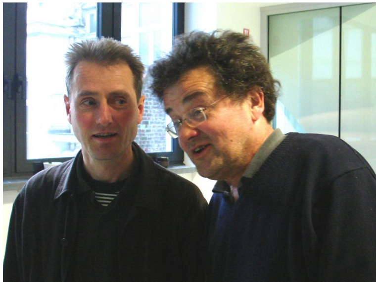
k michel/t oosterhof