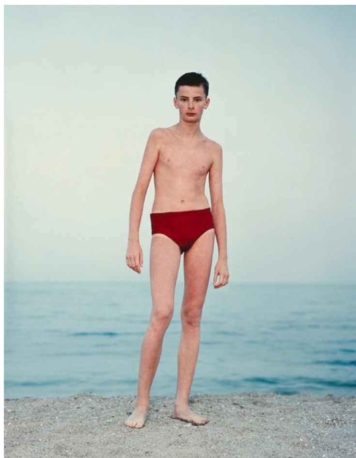
odessa, ukraine. rineke dijkstra. 1993

met vrouwenhaat te maken heeft, maar als ik diegedachte uitspreek tegen mijn vriendin antwoordt ze: 'het gaat toch niet goed tussen jullie, waarom maak je dat meteen politiek en verbind je daar vrouwenhaat aan?' ze meent dat het is alsof mijn moeders stem in mij huist, voor mijn moeder is alles een politiek gevecht en als een relatie tussen een man en een vrouw niet goed gaat, heeft dat voorhaar meteen een feministische lading. ze wil dat ik me daarvan losmaak. 'je hoeft je niet achter dezelfde façade te verschuilen als zij.