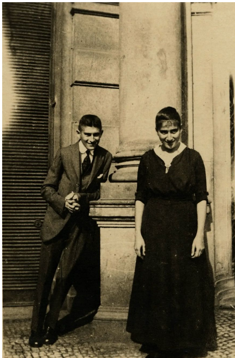
franz en otla kafka

maar de oorzaak daarvan niet kon zeggen. al zijn eerdere levendigheid was verdwenen.