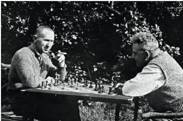
bert brecht en walter benjamin

net zo ongemerkt als de ziekte zich in het begin over me ontfermd had, nam zij ook weer afscheid. maar wanneer ik haar al bijna weer helemaal vergeten was, bereikte een laatste groet van haar me nog op mijn rapport. het aantal verzuimde uren stond onderop aangetekend. ze leken me volstrekt niet zo grauw en eentonig als die waarop ik aanwezig was geweest, maar ze stonden als de kleurige lintjes van een oorlogsinvaliden op een rij. ja, een lange rij eretekenen was in mijn ogen het zinnebeeld van de opmerking: verzuimd-honderddrieënzeventig uur.