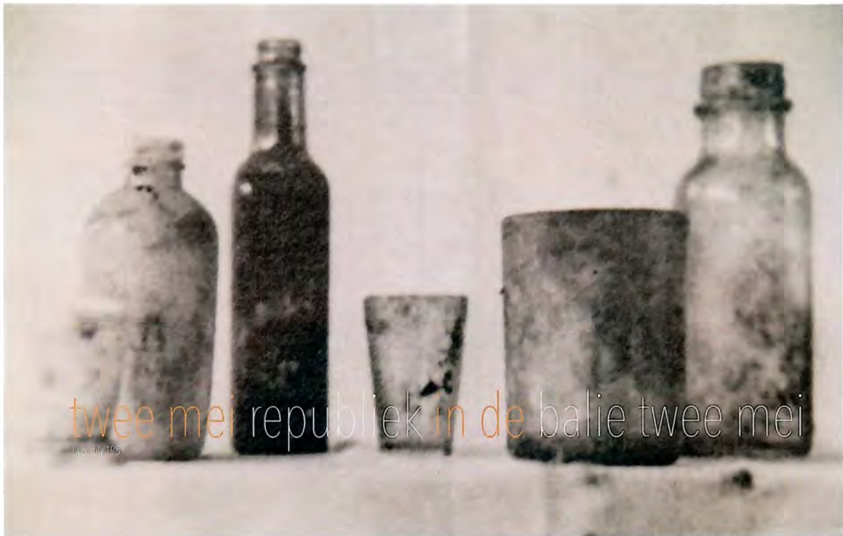
beeld voor de Republiek in mei , geschilderd door Giorgio Morandi, uitnodiging ontworpen door Jan Joris Lamers