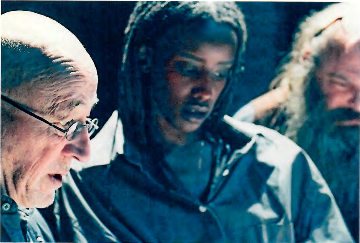
scènefoto van Rambuku door Tim Wouters