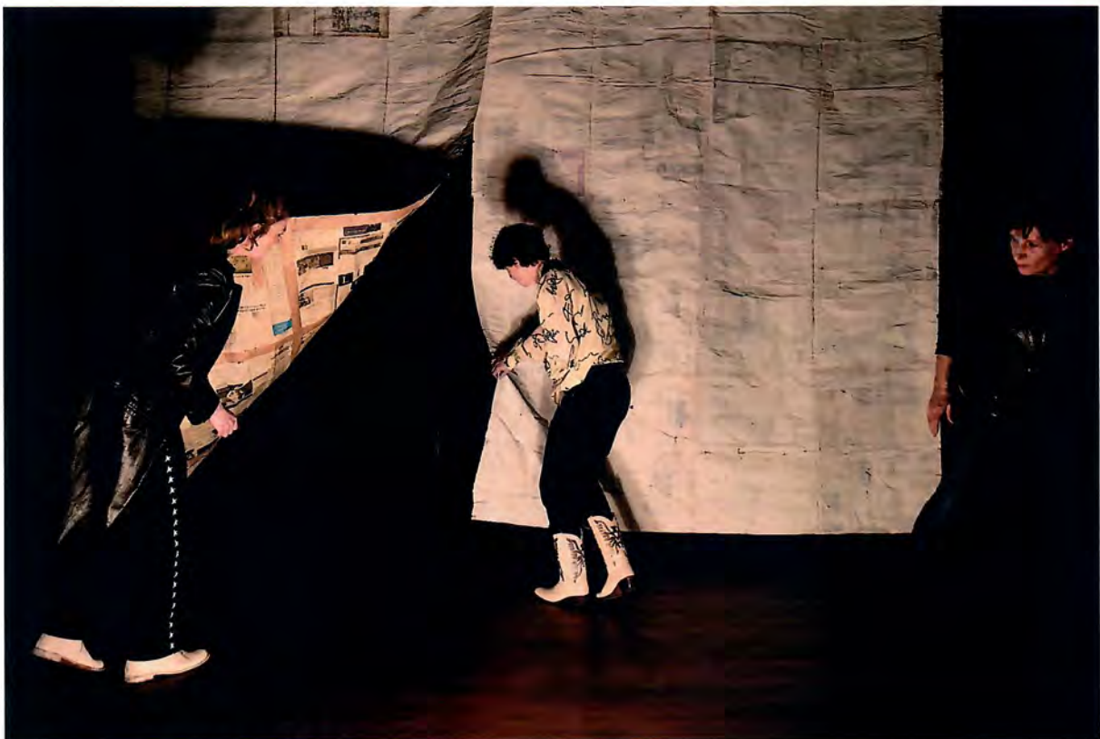
scènefoto van Love Sontag door Sofie Knijff

Alles wordt in deze voorstelling aangestipt, op een bedrieglijk lichtvoetige wijze, waarin drie actrices op zoek gaan naar één personage. Vrijelijk associërend horen we hoe ongepast het is om een rolletje ham te eten bij het kijken naar de film Babe. Maar ook wat de waarde is van fotografie: voordat je het weet ben je als argeloze toeschouwer terug bij dat jongetje in de zandbak – zo prikkelt Discordia de fantasie. En voordat je het weet, is het alweer afgelopen. Hein Janssen, De Volkskrant, 4 maart 2022